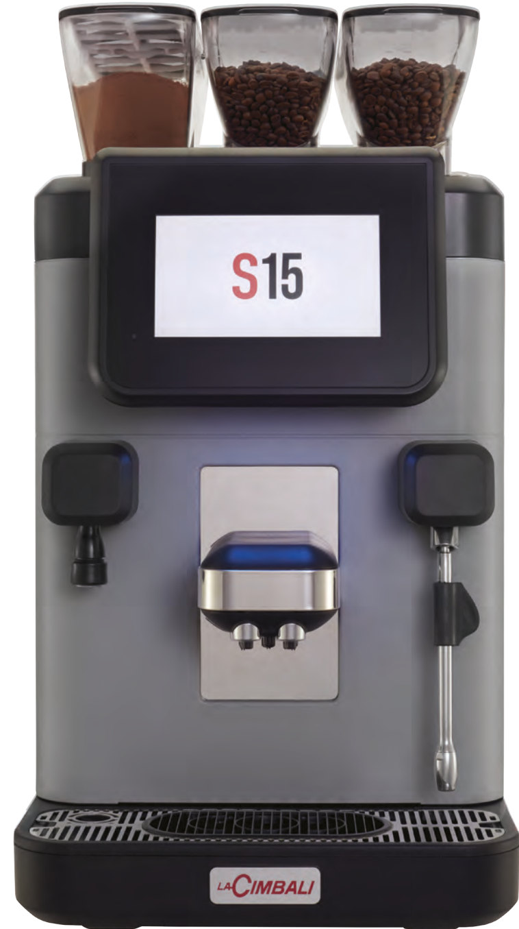
LaCimbali S15 – Vorderseite und ¾ Vorderansicht