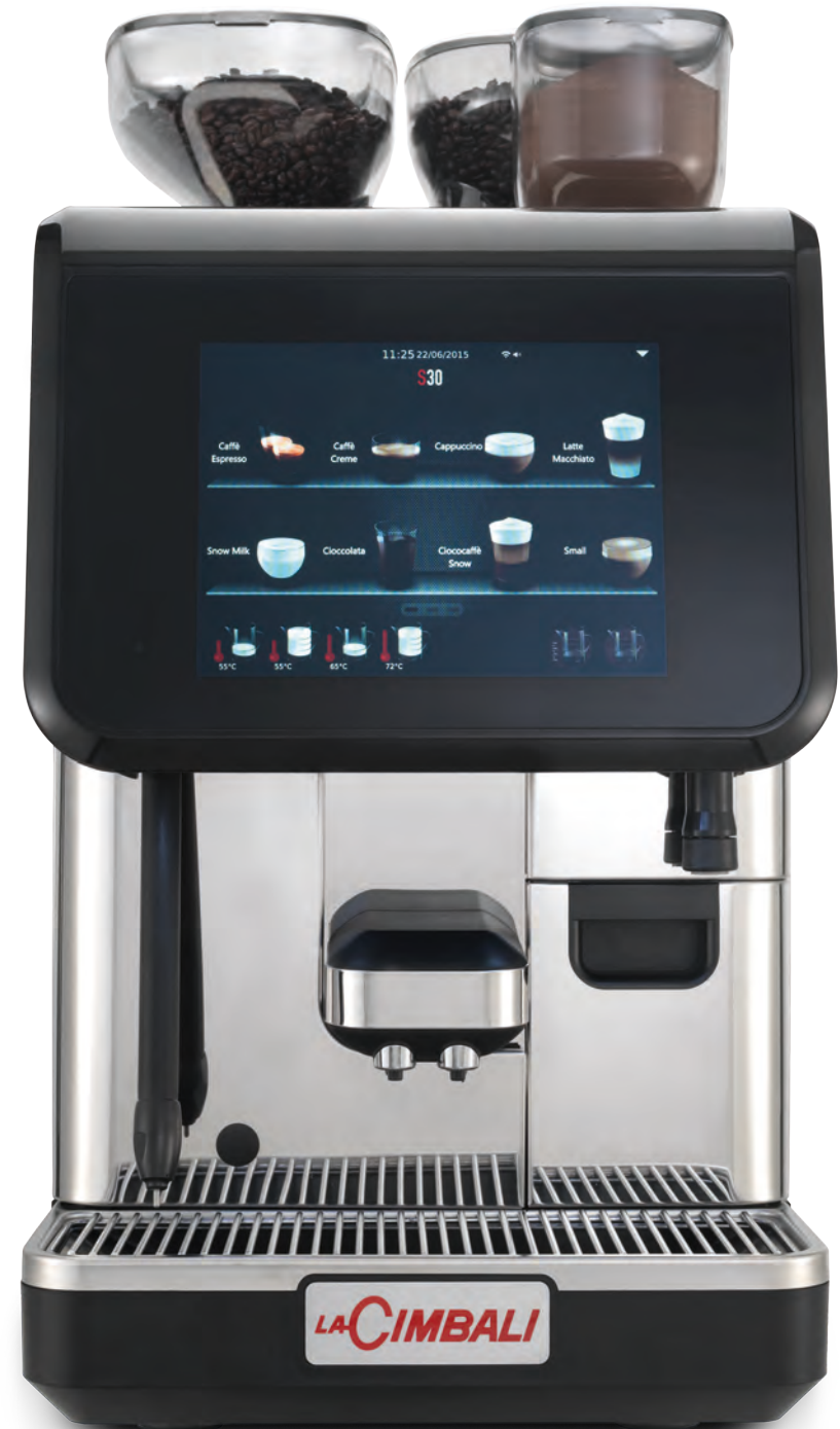
LaCimbali S30 – Front and ¾ front view

Leistungskapazität von bis zu 300 Tassen pro Tag bei gleichbleibender Qualität.