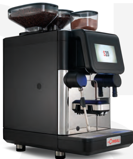
LaCimbali S20 – Front and ¾ front view

Leistungskapazität von bis zu 200 Tassen pro Tag bei gleichbleibender hoher Qualität.