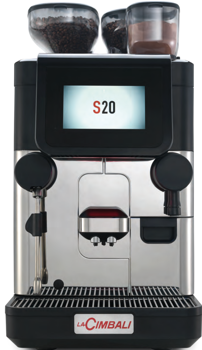
LaCimbali S20 – Vorderseite und ¾ Vorderansicht