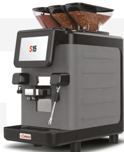
LaCimbali S15 – Front and ¾ front view

Integriertes System für Trinkschokoladenpulver, plus Milchkreislauf für Rezepte mit heißem Milchschaum. Beide Systeme sind mit einem automatischen Spülsystem ausgestattet.