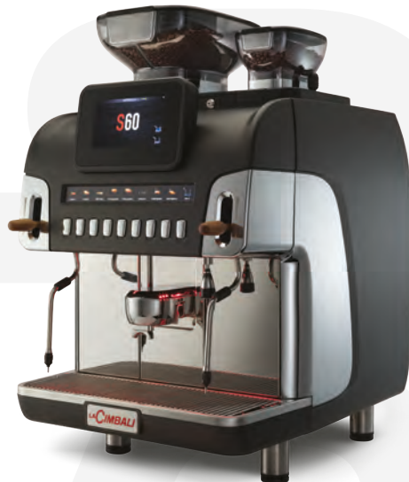
LaCimbali S60 – Front and ¾ front view

Eine intelligente Maschine mit bidirektionaler Telemetrie, Fernsteuerungsoptionen und der Möglichkeit, eine Verbindung zur CUP4YOU-App herzustellen.