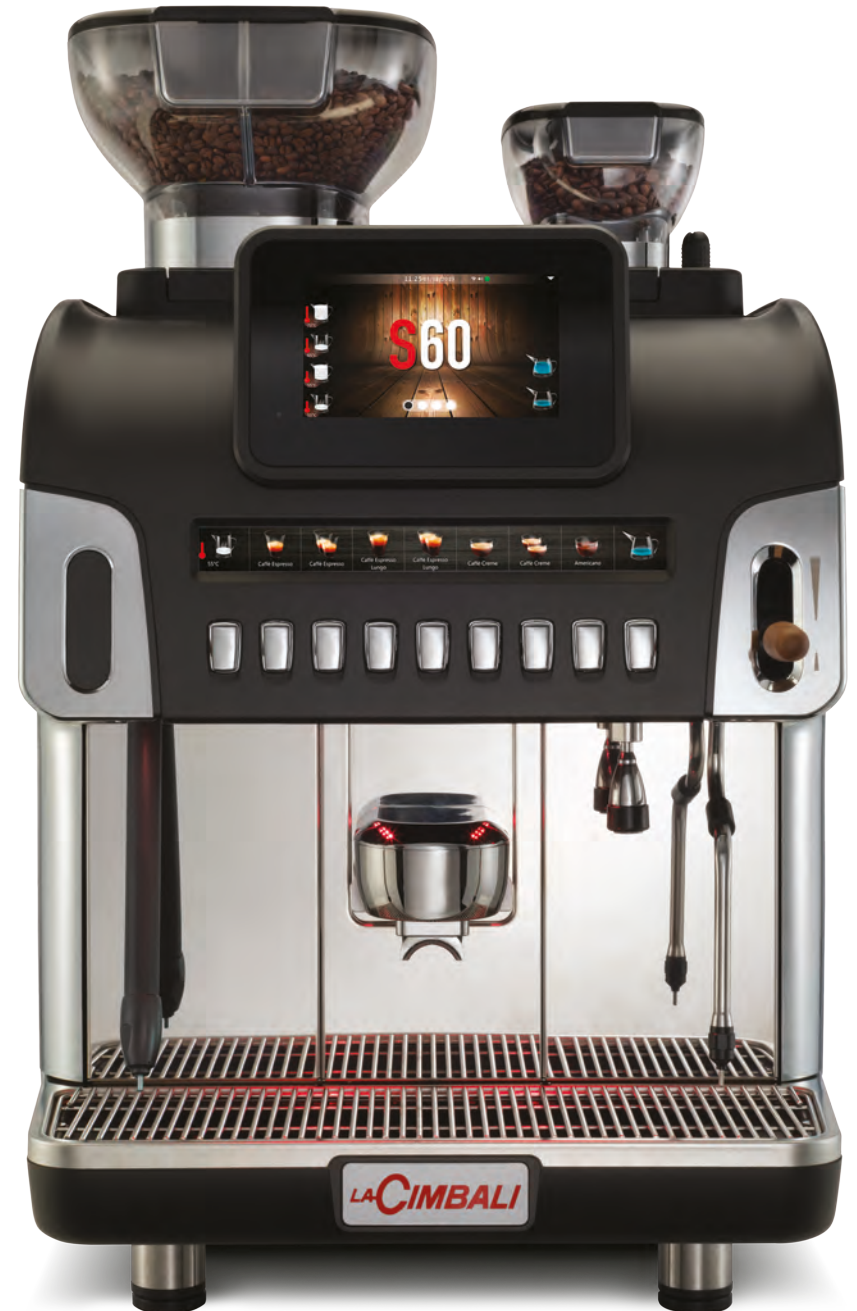
LaCimbali S60 – Vorderseite und ¾ Vorderansicht